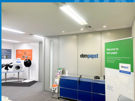
新横浜オフィスエントランス