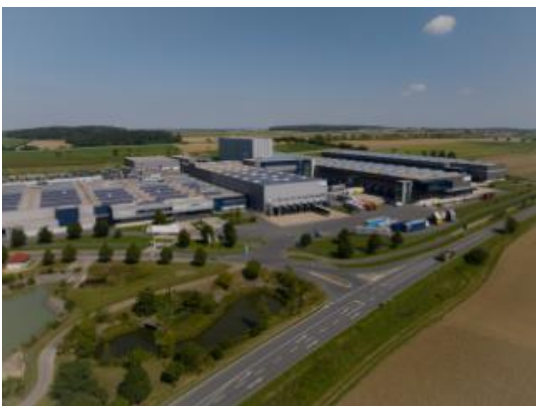
Bild 2: Im neuen Erprobungszentrum werden alle am Stammsitz anfallenden Validations- und Erprobungskapazitäten zentralisiert.