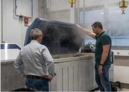
Bild 4: In der Salznebelprüfkammer wird die Qualität der Beschichtungen und Materialien untersucht.

Zeichen ca. 3.100, mit Überschriften und Zwischenüberschriften Tags Erprobungszentrum, Prüffelder, Validierung, Qualitätssicherung, Qualität, Produktsicherheit, EC-Technologie, Axialventilator, Radialventilator, Umwelteinflüsse Link https://mag.ebmpapst.com/erprobung