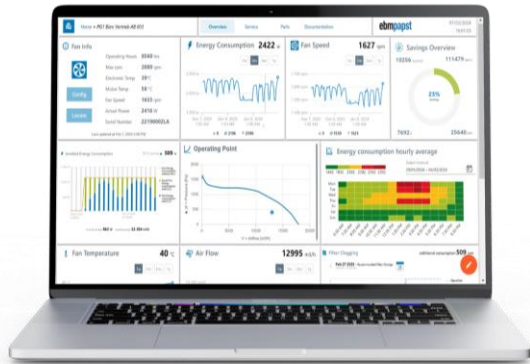
Bild 1: Die epCloud ist das Zentrum, in dem die Anlagendaten zusammenlaufen und überwacht werden können. Hier werden auch die Basisfunktionen und Digital Services abgebildet.

twitter.com/ebmpapst_news facebook.com/ebmpapstFANS youtube.com/ebmpapstDE www.ebmpapst.com