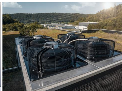
Bild 1 a/b: Umstieg auf mehr Intelligenz: ebm-papst öffnet seine eigenen Türen in eine Welt voller digitaler Mehrwerte. Durch Gateways, intelligente Ventilatoren und die epCloud werden digitale Mehrwerte gehoben.