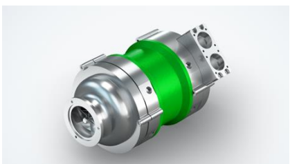
Bild 3: Öl- und vibrationsfrei sowie verschleißarm: der kompakte High-Speed Kompressor Plattform P2.