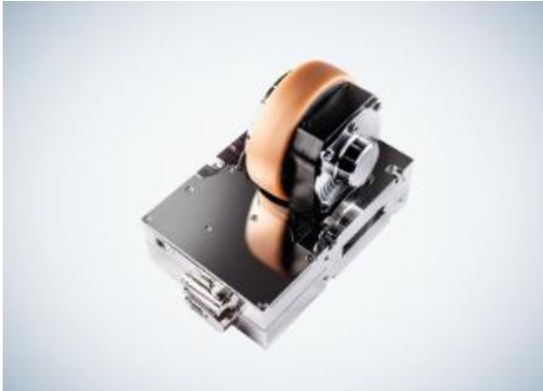
Bild 1: Der ArgoDrive ist das Fahr-Lenk-System für flächenbewegliche Fahrzeuge von ebm-papst – es hat sich bewährt und arbeitet mit Fahrzeug- und Safetysteuerungen verschiedener Hersteller.